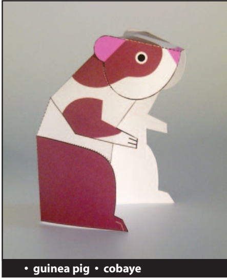
• guinea pig • cobaye

EN 1. Score (ruler and a burnisher or a knitting needle) Put the ruler along the dashed line and score over it with the help of the burnisher (or the needle). This operation allows a net and precise folding.